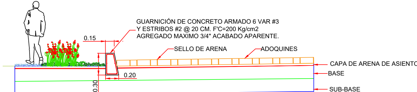
DETALLE GUARNICION S/E